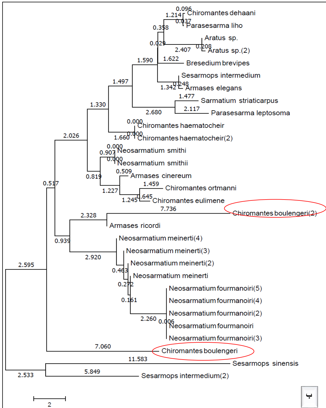
شکل ۳. روابط فیلوژنی گونه های انتخاب شده از جنس Chiromantes و دیگر Sesarmidae ها. الف، بر اساس Maximum composite Likelihood با ۵۰۰۰ تکرار، ب، بر اساس Neighbor- Joining.

(ایران) داشتند (شماره های دسترسی: FN296219- FN296220). آنالیزهای مولکولی، طبق درخت فیلوژنی (شکل ۷) نشان دهنده ارتباط نزدیک بین جنس Chiromantes با جنس Neosarmatium می باشد.